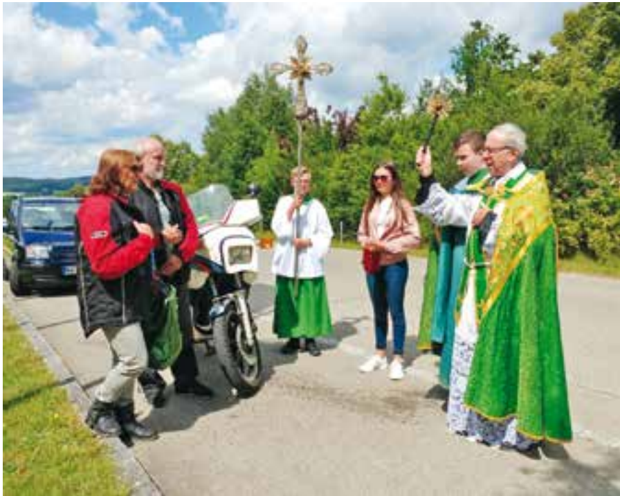
Fahrzeugsegnung auf beiden Parkplätzen der Wallfahrtskirche