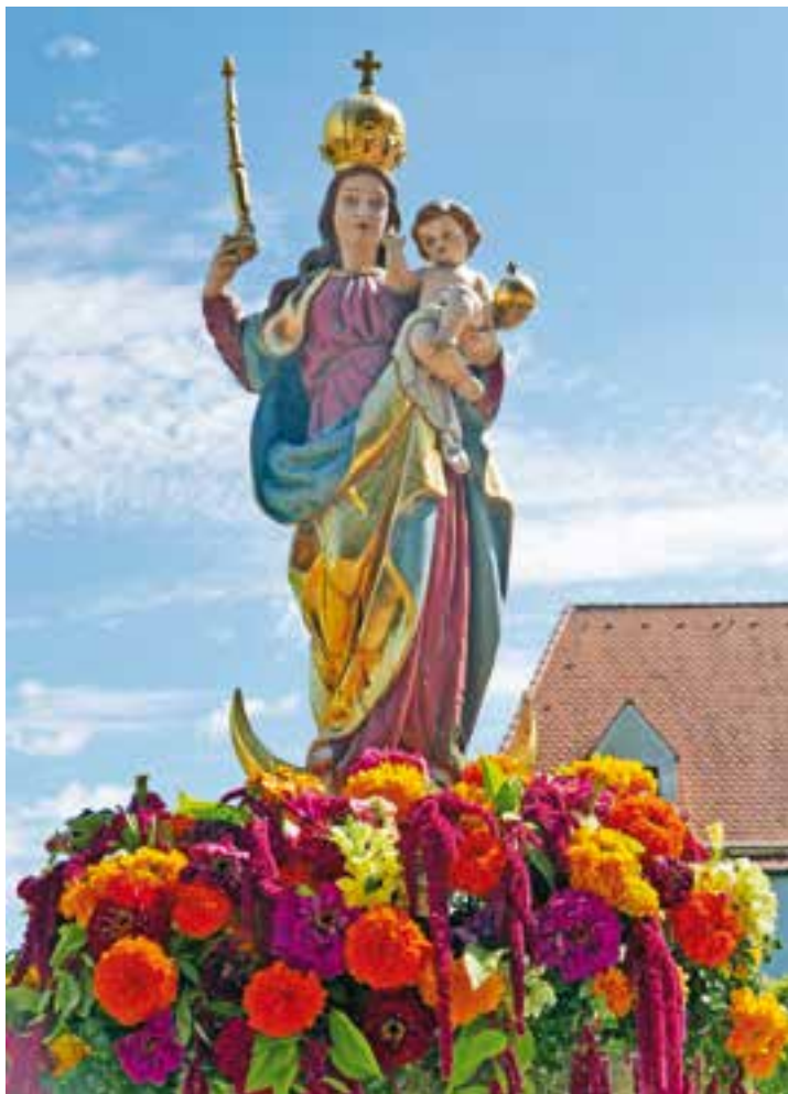
Maria, Schutzfrau Bayerns (Patrona Bavariae) auf dem nördlichen Kirchenvorplatz

Maiandachten sind donnerstags, samstags und sonntags jeweils um 18.40 Uhr!