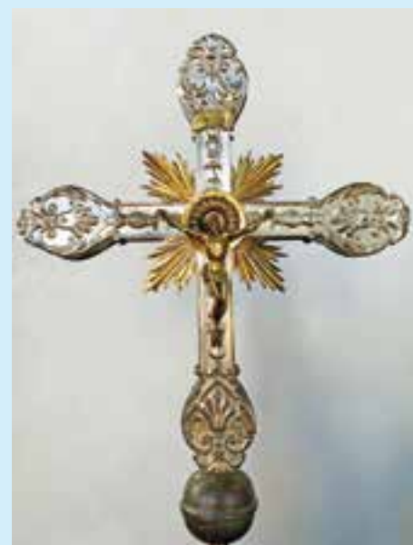
Vortragskreuz Maria Vesperbild